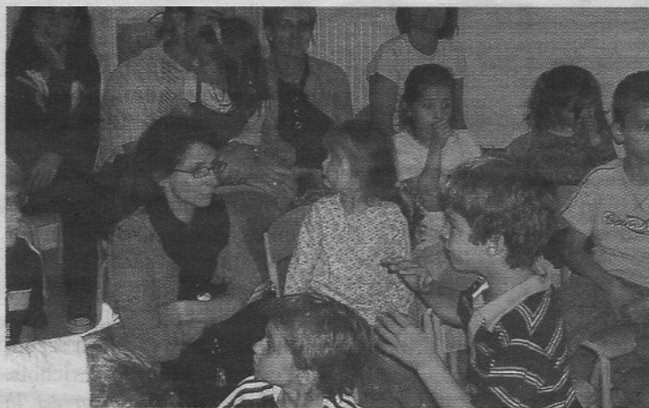
Le CLSH serait-il déjà trop petit, un an après son inauguration ?

Le décor était donc planté pour aborder la délibération sur le budget supplémentaire avec des propos à la hauteur. C'est M. Dauvergne, opposi-